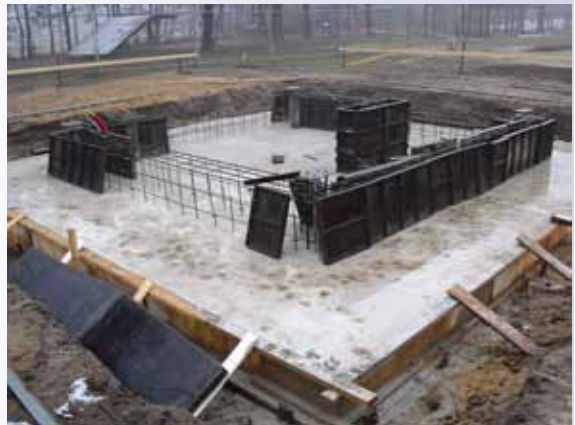
De nieuwe fundering.

en omdat die nog constructief bekeken moesten worden, kon de fundering nog niet gestort worden. Dit vergde natuurlijk