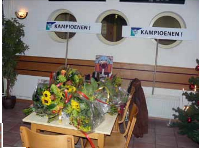
Bloemen voor de kampioenen.