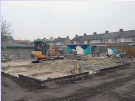
Het aan peil brengen van de 6 volgende woningen in Maarheeze.