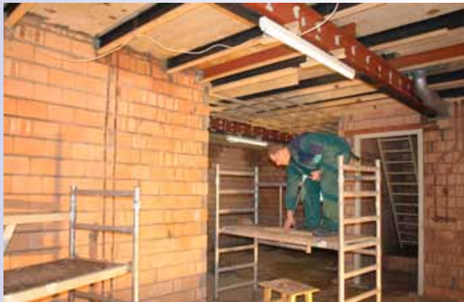
Op deze foto is te zien dat er een nieuw plafond in wordt gemaakt en dat de bestaande stalen balken versterkt zijn.

dek van de hooizolder maar zo’n vijf centimeter dik was, moesten de stalen liggers waarop de vloer rust, versterkt worden. Dit gebeurde door aan weerszijde een nieuwe stalen balk aan te brengen. Na het optrekken van de lichtgewicht binnenwanden, worden op de vloer van de vertrekken zwaluwstaartplaten gelegd, hierop komt een gietvloer. Hierdoor krijgt het dek meer stabiliteit.