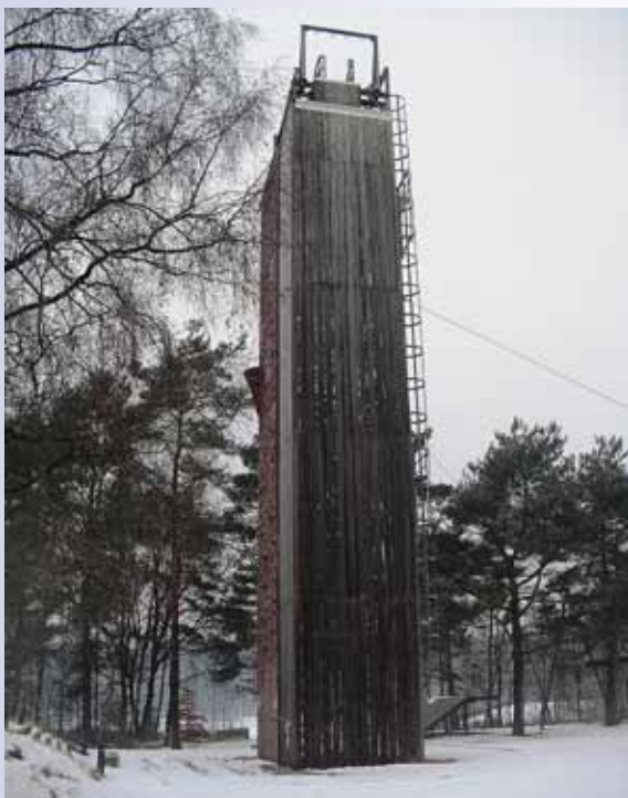
De oude klimtoren.

voorzien van een rotsdecor en de vierde zijde is open. Hier bevindt zich de toegang tot de trappen. Aan deze zijde ligt ook de tokkelbaan van 40 á 50 meter lang. Op tien, vijftien en twintig meter liggen vloertjes, die een ruw en stroef oppervlak hebben door de bovenlaag waarin oude autobanden verwerkt zijn.