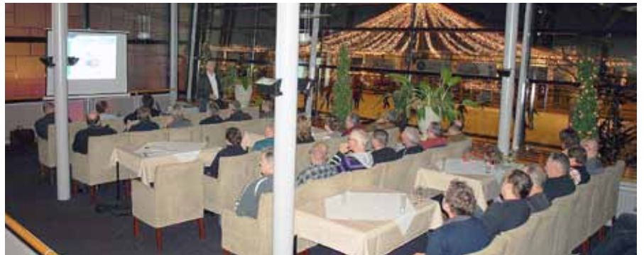
De halfjaarlijkse bijeenkomst van Raedts vond dit jaar plaats in de Schouwburg / theatercafé De Artiest in Venray, met op de achtergrond de schitterende verlichte schaatsbaan.

vatie, restauratie, onderhoud, verbouw en beheer voor professionele opdrachtgevers plus nieuwbouw, die bij voorkeur samenhangt met de markt voor onderhoud en renovatie. Ook het verwerven van vaste opdrachtgevers staat in het jaarplan ver-