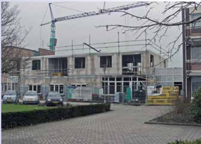
Voorgevel blok A.