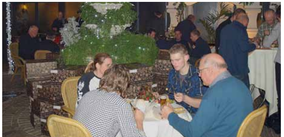
Voor de medewerkers van de Bouwmij was het na het officiële gedeelte goed toeven bij De Witte Hoeve in Venray.

meld. Bouwmij Janssen gaat zich, met het ontwikkelen en bouwen voor professionele klanten in de utiliteits- en seriematige woningbouw, vooral richten op integrale projectbenadering, waarbij de opdrachtgever al het werk uit handen wordt genomen en één aanspreekpunt heeft dat gericht is op kwaliteit, service en samenwerking.