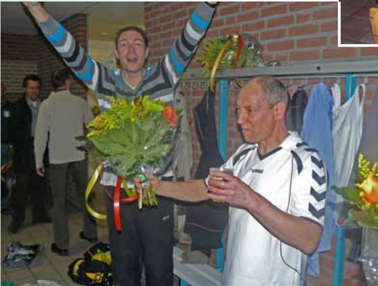
Hier moet op gedronken worden.

aan hen een kleinigheidje uit. Na de eerste editie van de bedrijvencompetitie gemeente Venray, volgt een tweede en het is nu al bekend dat de tegenstand dan sterker zal zijn. Voor onze kampioen mag de lat best wat hoger gelegd worden. Misschien een tip voor de directie om in eventueel te plaatsen advertenties, voor hoogwaardig personeel, de pre 'voetballer zijn op niveau' toe te voegen. Mannen, gefeliciteerd en op naar een volgend kampioenschap.