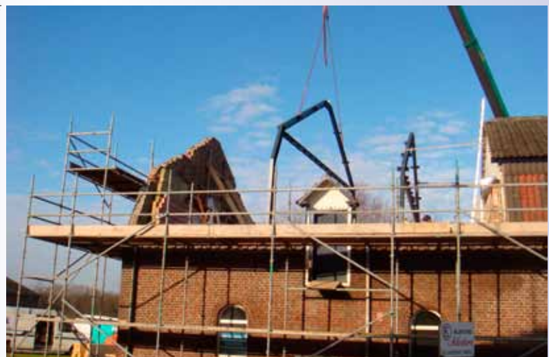
Het plaatsen van de spanten voor het nieuwe dak. Ook zichtbaar een soort dakkapel waardoor vroeger het hooi op de hooizolder gestoken werd.