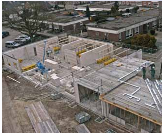
Wanden blok D en storten vloer blok C.

Voor de inrichting van de Zorggroep woningen is de opdrachtgever nog steeds druk bezig de laatste ervaringen van andere projecten te verwerken in dit plan. Dat heeft te maken met ervaringen die men heeft opgedaan hoe de cliënten van de Zorggroep zich het prettigst vinden in hun omgeving. Deze omgeving wil men zo-