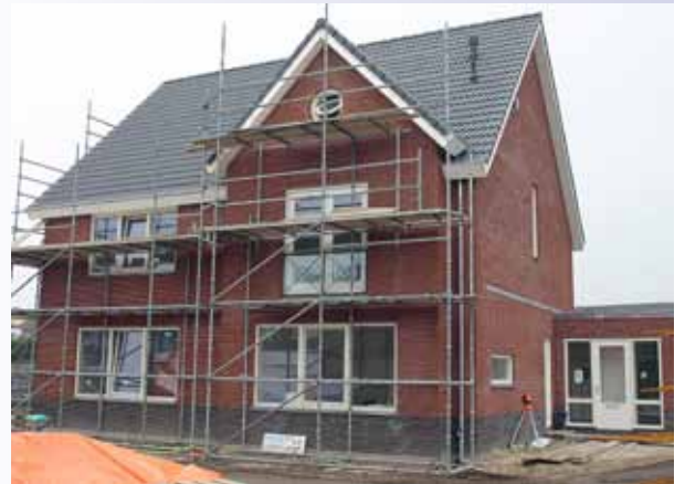
De in maart opgeleverde kavels 7 en 8 in Maarheeze

de tuinzijde een dubbele tuindeur. Het ontwerp van Margry Arts Architecten BV uit Valkenswaard heeft verder op de begane grond een hal, toilet en trappenkast. Boven vinden we twee grote slaapkamers en een kleine, met een badkamer. De zolder is vrij groot te noemen, hier kan nog van alles mee ge-